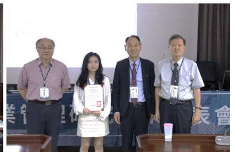
作者：林裕昌、周品好