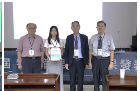
作者：張少俞、杜功仁