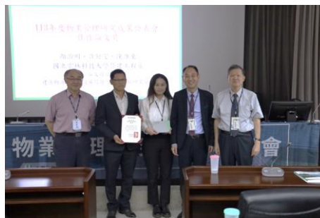
作者：顏治明、許舒雯、陳維東