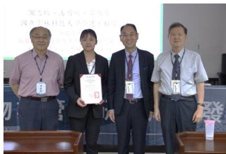
作者：謝之瑢、潘乃欣、黃盈棻