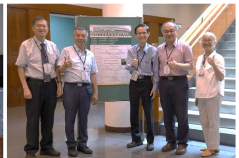
學會理監事蒞臨指導