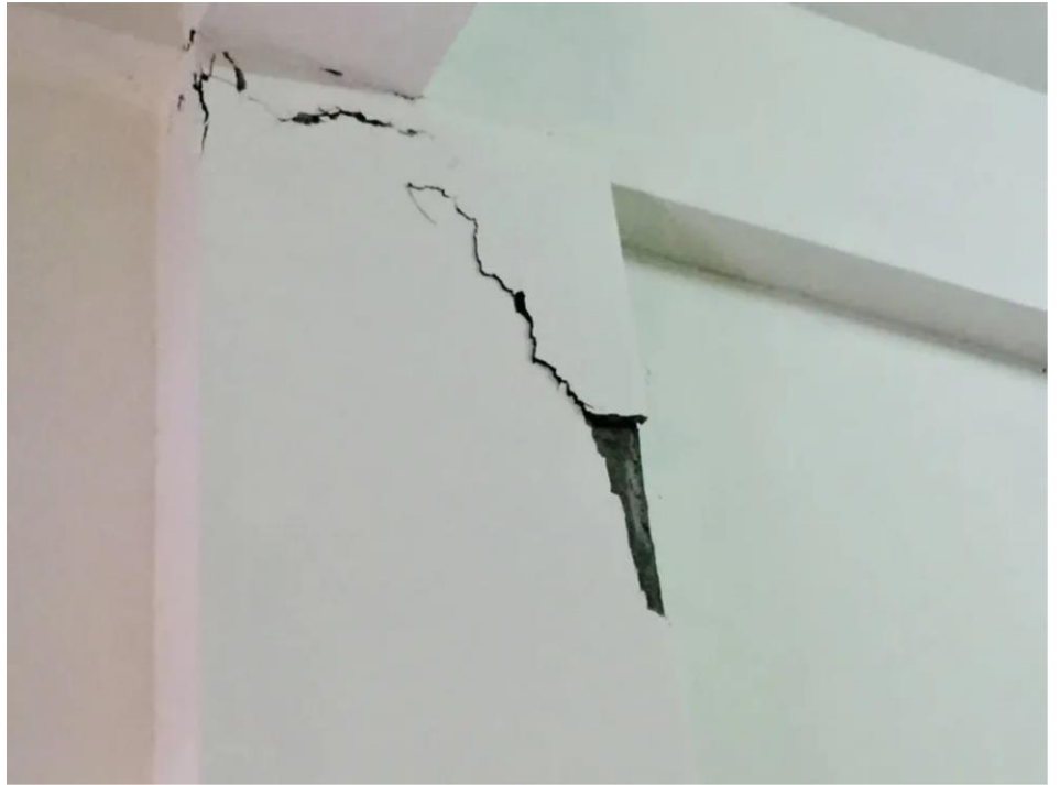
民眾可以針對家中的大柱、大樑檢查，看看有沒有出現 45 度的裂縫，也要特別注意低樓層的結構狀況。

在發生地震的當下，戴雲發建議民眾應就近趴下並尋找掩護，更重要的是，地震過後也應積極檢查自家房子的狀況。民眾可以針對家中的大柱、大樑檢查，看看有沒有出現 45 度的裂縫，也要特別注意低樓層的結構