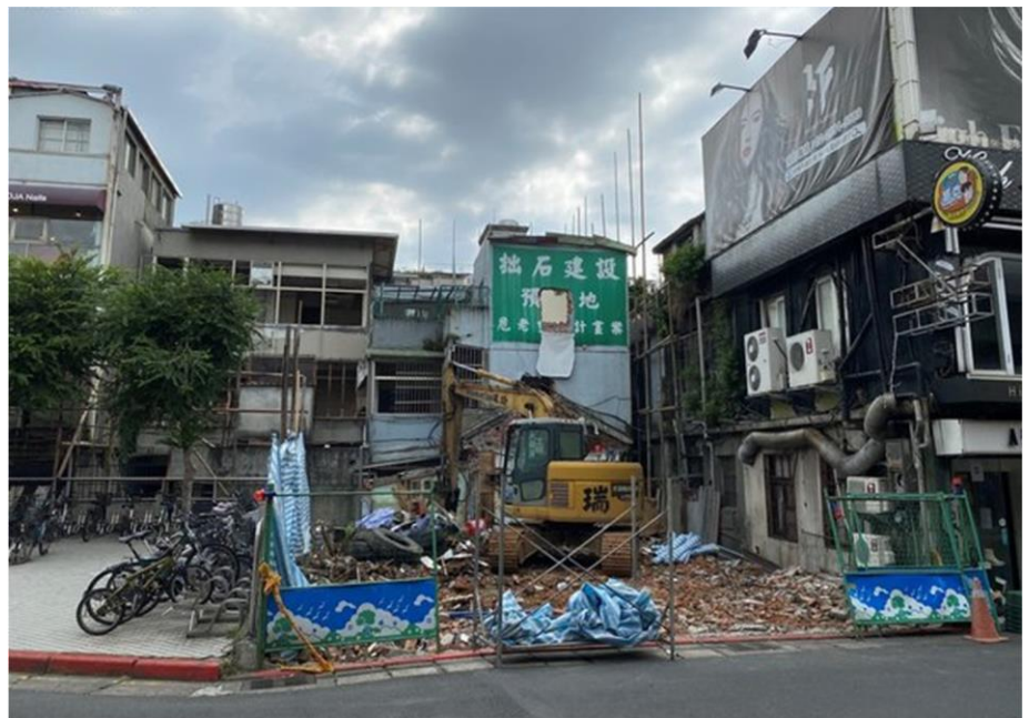
危老獎勵再減 2%，倒數 30 日北市從寬收件。示意圖

按 109 年 5 月 6 日修正的危老條例第 6 條規定，條例施行後 3 年內申請的重建計畫，給予各該建築基地基準容積 10% 的時程獎勵，之後逐年遞減，另重建計畫內基地面積達 200 平方公尺者再給予基準容積 2% 規模獎勵，每增加 100 平方公尺，另給予 0.5% 規模獎勵，因此到今年 5 月 12 日後，重建計畫內基地面積需達 600 平方公尺，時程