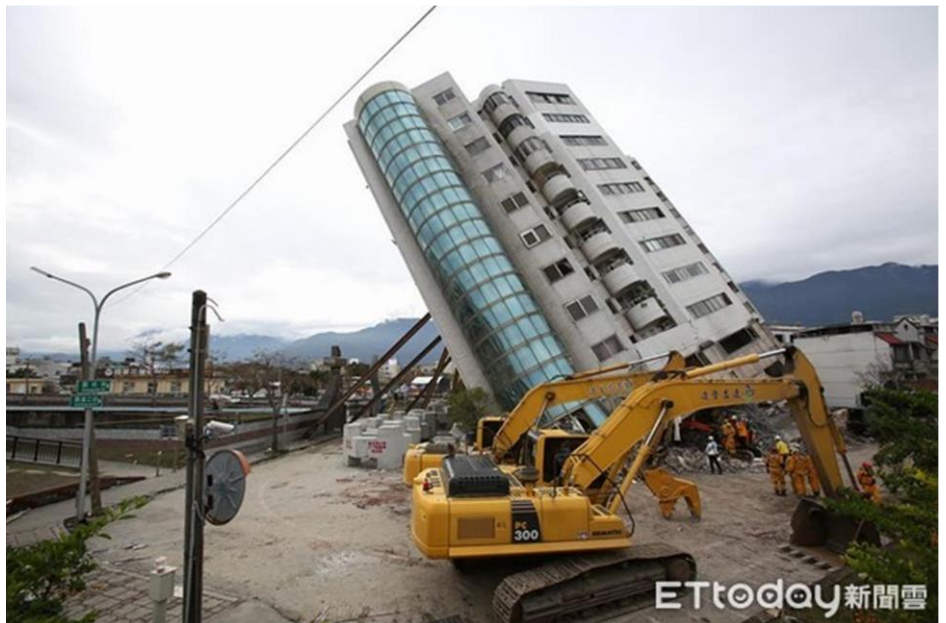
有立委提出修正《建築法》第 13 條，刪除建築師就設計監造需擔負的連帶責任，那建築物的安全該由誰保障呢？圖為 2018 年 2 月 6 日的花蓮大地震造成花蓮雲門翠堤大樓倒塌。

觀其修正理由，竟是認為本法條中建築師的「連帶責任」，在建物使用人或業主因而受有損害時，可回歸《民法》相關法理請求損害賠償或連帶賠償，因此屬多餘文字而予以刪除。然而，《建築法》第 13 條於 1975 年修法時，其架構已訂