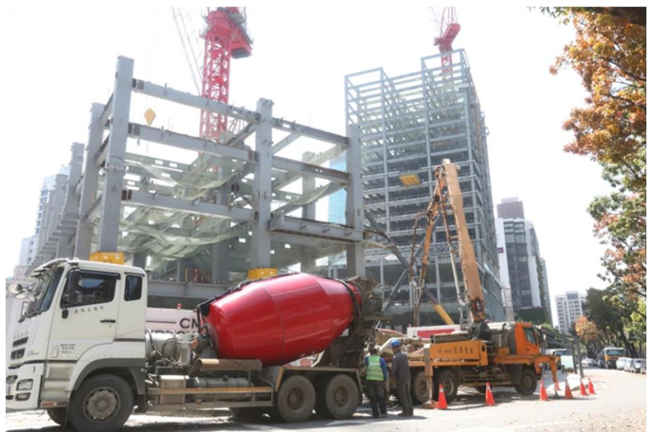
各縣市政府對於震後工地都有安全把關機制，台中地震震度達 4 級以上須提供報告。示意畫面

社團法人建築安全履歷協會創會理事長戴雲發說：「備查制度主要是怕影響『灌漿』中的工地，受地震影響產