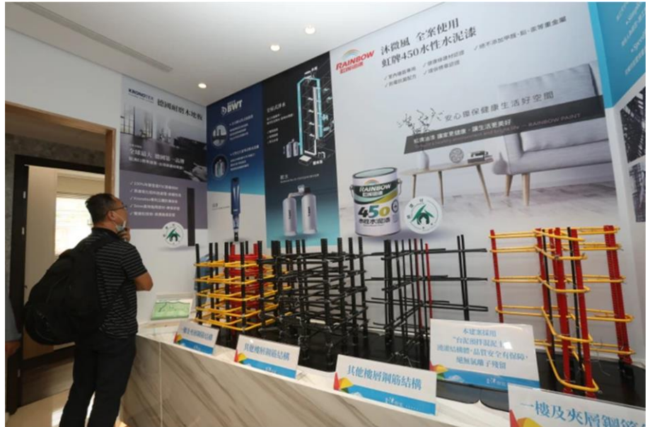
結構安全是購屋族最重視的一環。示意畫面

按都發局盤點表示，震後迄今台中營建工地無傳出災情，其中這次震度達 4 級的工地達 15 處，(19)日已