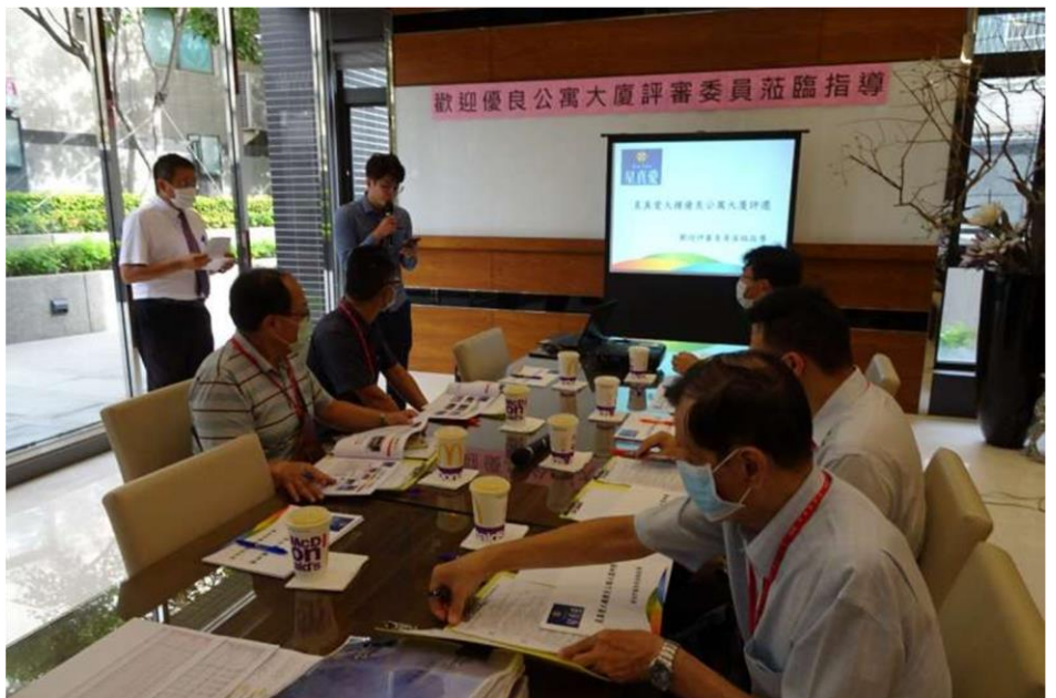
工務局呼籲大廈成立管理組織進行自治管理機制，即所謂的管委會。

一般民眾認為要成立管理組織是很困難的事，為考量簡政便民，工務局已將公寓大廈管理組織成立及改選報備事宜授權全高雄市 38 個區公所辦理，市民可就近至當地區公所申請。大樓如要成立管理委員會，則可先向當地的區公所洽詢所需檢附的資料，大樓住戶較少，可以考慮用推舉的方式選出管理負責人，只需由 2 人以上之區分所有權人推舉公告 10 天即可，就可以依法執行管理維護事務，且無論是管理委員會或管理負責人都具有當事人能力，甚至可向法院訴請強制執行。