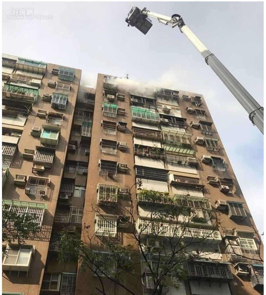
台灣公寓常見加裝鐵窗，發生火災容易阻礙逃生。示意圖

YouTuber 建築先生曾指出，正常使用的電線壽命約為15年，8、90年代建造的房子，電線直徑為1.5平