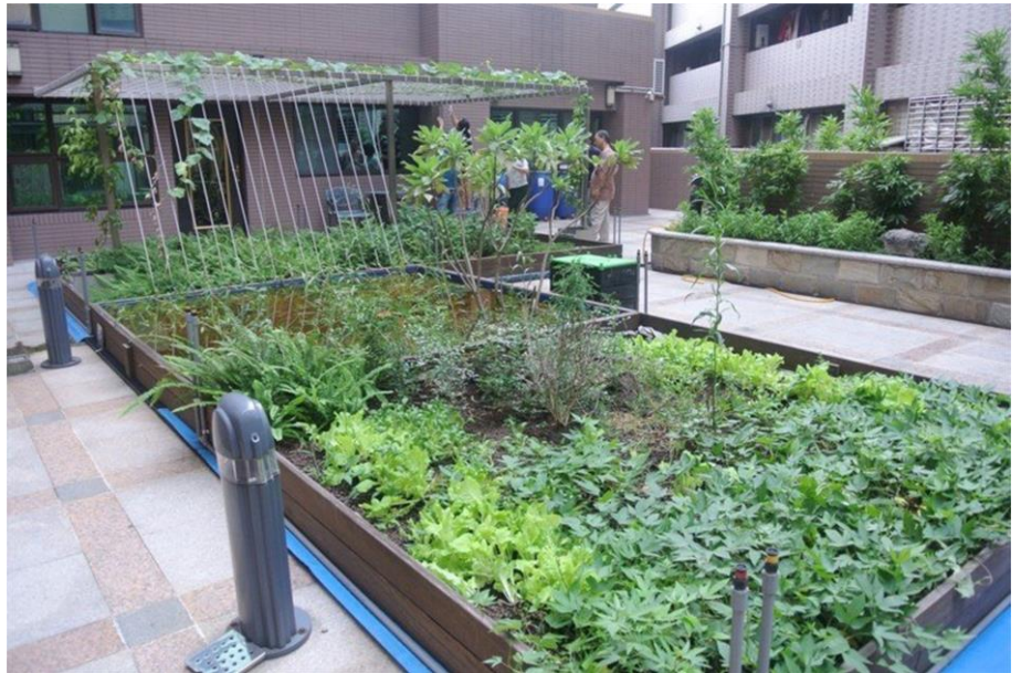
新北環保局指出，屋頂施作綠化，可避免太陽直射屋頂並降溫。