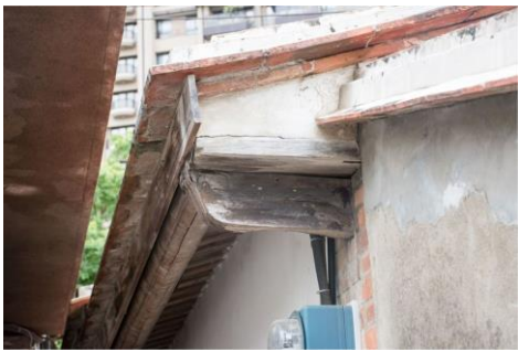
(出展起) 地點：新瓦屋客家文化保存區