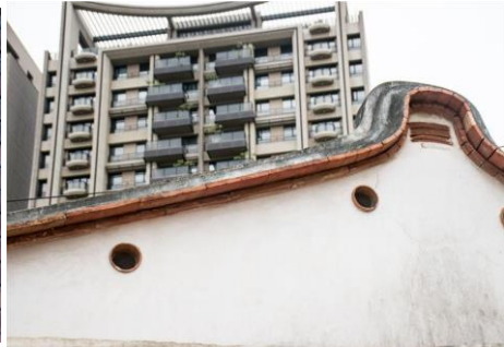
(通氣孔與通氣口) 地點：新瓦屋客家文化保存區

外型跟木屐很像，因此又名為出展起。受到氣候影響，在台灣南部較為常見，但仔細觀察，在新竹的傳統建築中還是找得到。