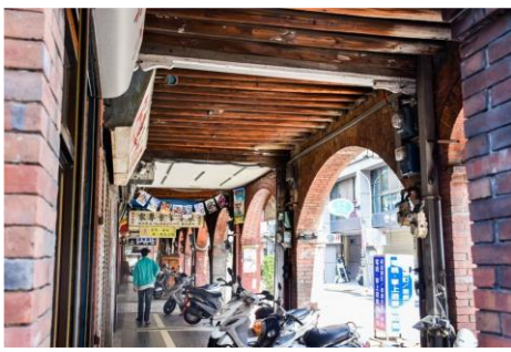
(亭仔腳) 地點：新竹市中央路一帶