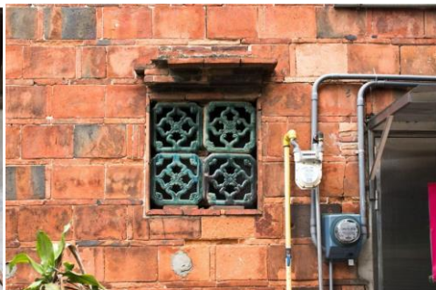
(通氣孔與通氣口) 地點：新竹市長安街一帶