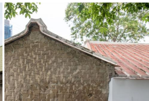
(土壑 (塙) 厝) 地點：新瓦屋客家文化保存區

頂的窗戶。這樣的設計叫做「老虎窗」，因為遠看像是老虎的嘴巴而被這樣稱呼（另有一說是因為英文「Roof」音似老虎）。老虎窗兼具採光、裝飾和通風的功能，可說是幫助沉悶的屋頂呼吸。在新竹要找老虎窗，絕對不能錯過新竹火車站經典的老虎窗設計，下次來搭車，抬頭看看吧！