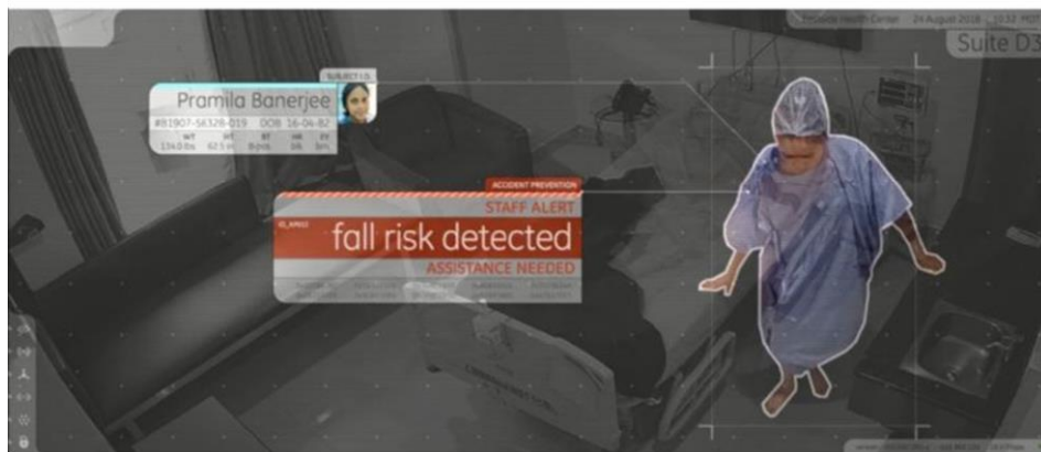
Self Aware Room 偵測到病患有可能有跌倒風險會即時傳送智慧警示通知醫護人員。care.ai

醫院中最常用的智慧建築技術是資產追蹤解決方案，善用連網設備收集的資料並跟 BMS 平台協作以提升營運效率，包括運用物聯網(IoT)技術與應用追蹤物品存量以及時補充，以及透過無線射頻識別(RFID)、藍牙信標(Bluetooth