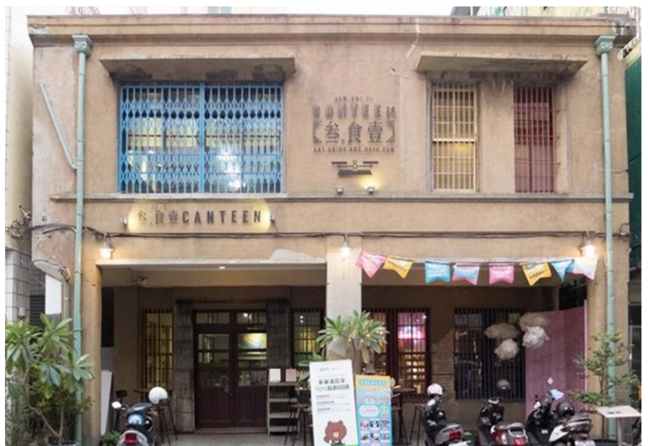
哈瑪星「叁食壹」老屋整修後。

都發局力推高雄老屋的保存，未來更將結合青創產業進駐。不僅補助私有屋主整修老屋，也將鼓勵進駐業