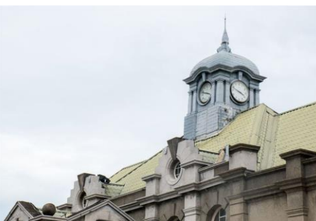
(老虎窗) 地點：新竹火車站