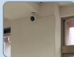
不佔空間，安裝簡便