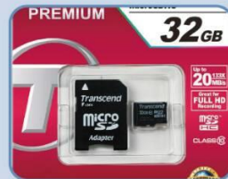
加裝SD記憶卡，可回放