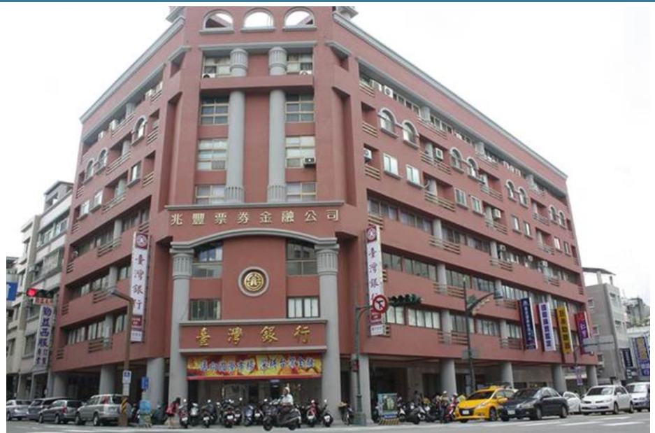
屋齡 30 年的長生金融大樓通過都發局審核，獲得 300 萬立面修繕工程經費補助完工，煥然一新。

位於台灣大道 1 段及平等街口、屋齡 30 年的長生金融大樓，前年通過都發局審核，獲得 300 萬立面修