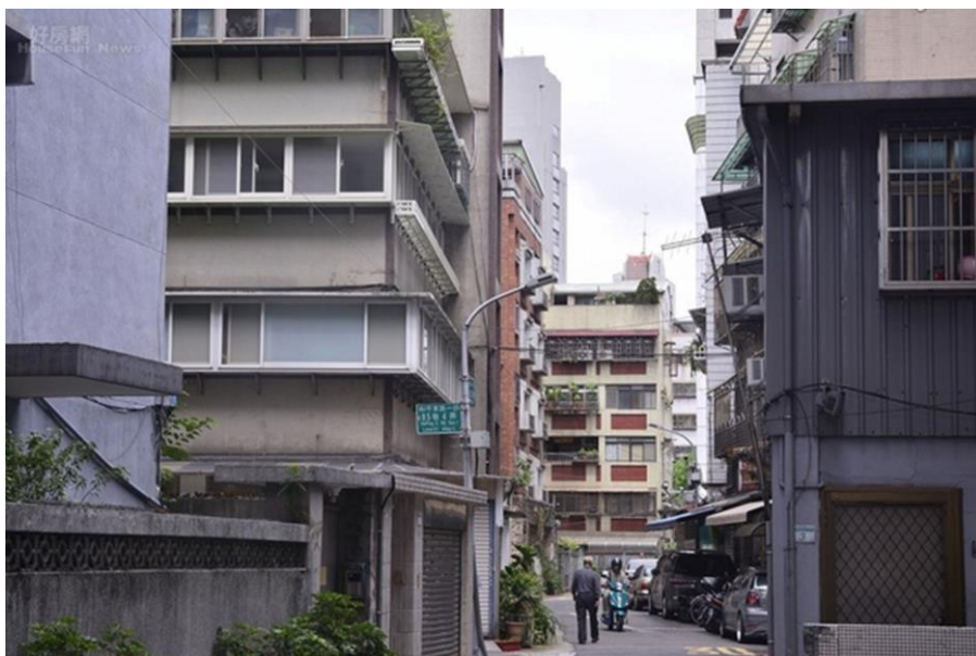
都更重建獎勵還是會卡在不同戶的問題。

目前草案獎勵內容包括，容積獎勵最高可達容積率的 1.4 倍，同時放寬遮蔽率 10%，更提供租稅獎勵，若 2 年內未移轉者，租稅優惠可延長至房屋脫手為止。舉凡 30 年以上經耐震評估須