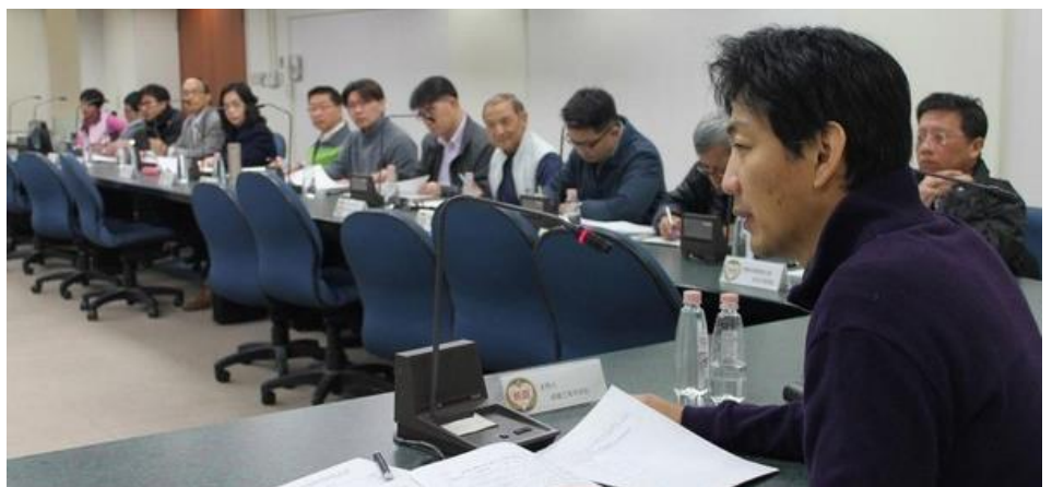
都市發展局邀專業團體一同辦理「老屋健檢」事務。