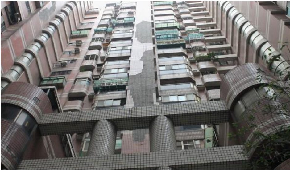
桃園市獲得內政部 3.8 億元補助。

桃園市長鄭文燦上任後推行住宅政策·透過興建社會住宅照顧弱勢家族及年輕人·同時還規畫「老屋健檢」套餐·免費提供 921 地震前建造的老舊建物辦理結構、外牆及升降設備的診斷服務·其中結構安全診斷項目· 獲得內政部 3 億 8 千萬元的補助金額·預計為 2.6 萬棟建築物辦理初部結構安全評估作業 ·是該市近年規模最大的建築物安全維護補助措施。