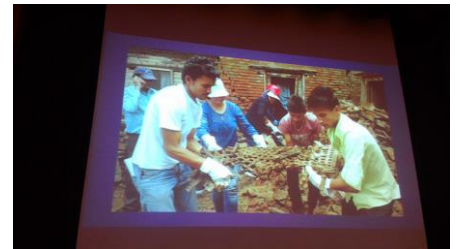
尼泊爾強震後，民眾不顧自身物產損失，紛紛投入協助搶救文化遺址構件。

當災難來臨時，應該優先救人命還是處理古蹟？他承認兩者不免拉扯，而災後文資如何兼顧安全，再現文化價值，連結全新歷史和過去，則左右著重建的成敗。他再補充，遺址往往牽涉當地經濟發展，跟居民生計息息相關，亟需整合產業復振，重建較可能獲得成功。