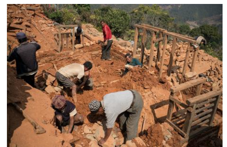
尼泊爾震災震壞不少古蹟民宅。

他指出，如今災害都不只單一因素，因水土保持不佳、強降雨再引發土石流、洪患，災害啟動另一個連鎖反應，比如 2012 年美國珊迪颶風過後，舊市區木造房屋失火；或 2010 年災後整修伊斯坦堡古蹟卻施工不當。除了洪水頻率大幅提高，乾旱亦容易導致森林大火，海平面上升、冰川融化等等各式天災，不時逼迫生命跟文化資產深陷浩劫。