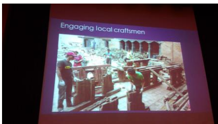
工匠技藝、傳統知識極為重要，文化內涵的展現影響重建效果。

另一方面，傳統知識、技藝、文化習俗等的流失也造成脆弱性，他憂心道，缺乏資源維修養護監控的文化遺產，難以建立老式建築的評估方式，加上傳統建材、結構不適應氣候變遷，在在增添文化資產應對災害風險的脆弱性。