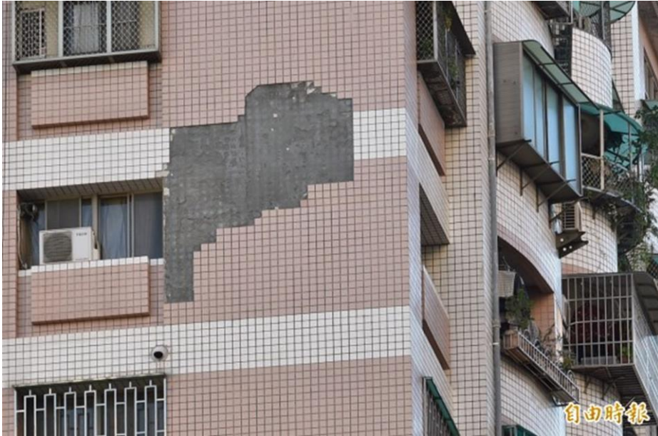
未來高雄市外牆有安全之虞的建築物，市府將可上網公告。

高市工務局因此在此條例中，增訂「外牆有損壞情況，經主管機關認定有影響公共安全，得將建築物名稱、地址、照片、損壞情形公布於電子網路網頁，並在建築物張貼危險告示。」另規定 6 樓以上建築物，管委會