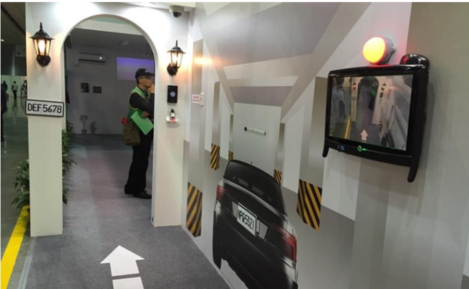
云辰電子的車牌辨識系統，直接以錄影機辨識車牌無誤後，就能自動進出停車場大門。

第27屆台北國際建築建材暨產品展 104 年 12 月 10 日起至 12 月 13 日在台北世貿一館及南港展覽館同步展出，免費參觀，規劃了智慧建築區、衛浴廚具區、家具家飾區、照明燈市區、綠建築綠建材區、地壁磚及裝飾建材區、兩岸展區等，攤位逾 1900 個，除台灣廠商，還有遠從埃及、波蘭、義大利等 12 個國家前來參展，開放時間