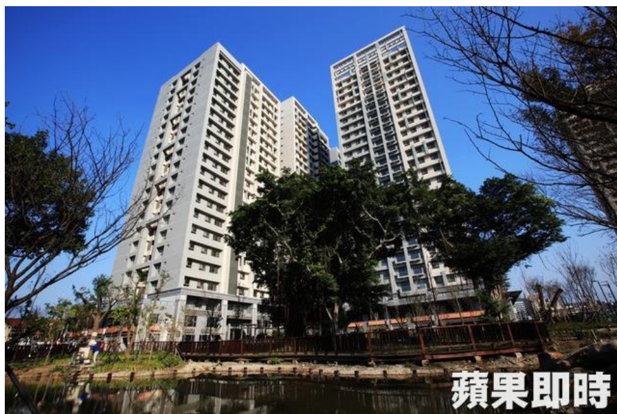
浮洲合宜住宅 A2 區已取得使用執照，預計 4 月可開始辦理交屋。

日勝生副總經理周惠玉便說，合宜住宅房價便宜，抽中的人等於穩賺的，真的除非繳款能力有問題，否則應不會輕易退訂。