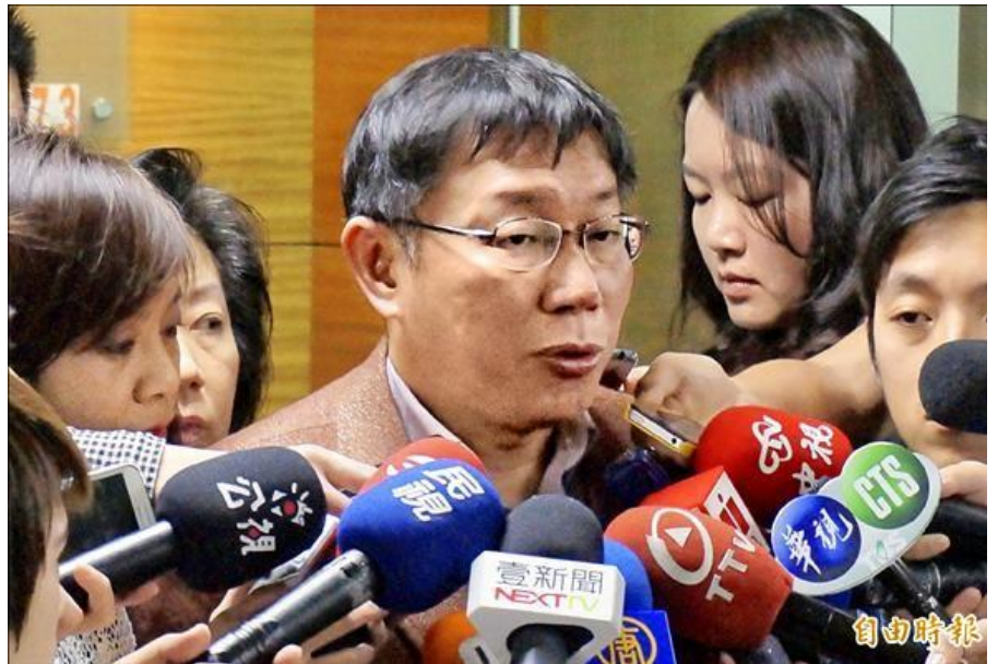
針對大樓外牆磁磚剝落防範方式，台北市長柯文哲 3 月 14 日表示，會通案處理，建管處預計一週內提出因應方式。

建管處副總工程司邱英哲說，為避免外牆磁磚剝落情事發生，里長、里幹事都會在里內巡查，並提報有安全疑慮的名單，目前全市有二百多處有磁磚掉落疑慮，但前日聯合報所屬大樓不在這份名單以內，因此，北市府去年就開始思考「例行健檢」年限，初步考慮從廿、廿五、卅年這三種年