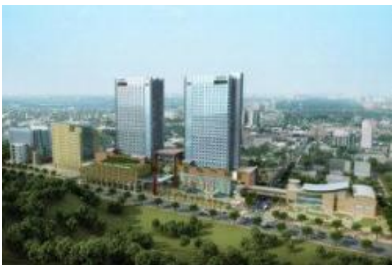
南港 BOT 案旅館外觀照片

為搶攻觀光產業「黃金 10 年」新商機，觀光集團無不展現旺盛企圖心，積極拓展事業版圖。已橫跨國際旅館、渡假旅館、主題遊樂園、電影院、連鎖零售烘焙、物業管理、營造建設的六福旅遊集團，日前宣佈與潤泰集團簽訂租賃契約，承租南港車站 BOT 案之辦公、飯店、商場的綜合商用大樓 7 至 30 樓作為國際觀光旅館，預計 2015 年底前正式開幕，並展現信心表示，將成為台灣未來 10 年最大型且擁有最多房間數的國際連鎖旅館。