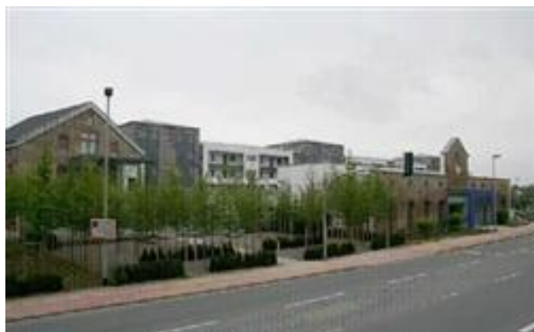
位於德國 Hattingen 鎮的銀髮照護住宅。

隨著人們開始重視生活空間與居住品質，全球都已吹起一股智慧生活趨勢，如何建立能滿足安全安心、健康照護、節能永續及便利舒適等不同生活型態的智慧化居住空間，更成為許多國家的重點建設項目。尤其在老年化社會來臨的今天，若能透過 ICT 科技幫助老年人在居家生活中能夠獨力自主，並有效提升生活品質，對促進社會發展，將有莫大的幫助。