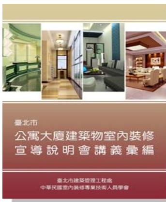
臺北市建築物公寓大廈室內 裝修宣導說明會講義彙編

本次說明會由建築管理工程處與中華民國室內裝修專業技術人員學會共同合辦，活動現場免費提供「臺北市公寓大廈建築物室內裝修宣導說明會講義彙編」、「護宅保命教戰守則-室內裝修 100 問」、「建築物機械停車設備安全管理 Q&A」、「建築物昇降設備安全管理 Q&A」及「電梯管理實用手札」等 5 冊書籍，凡前 300 名報到持入場券進場者，贈送精美小禮物乙份。現場並有本市大安區健康服務中心提供免費健康篩檢活動。活動當日如有攜帶水電表號者，可至現場環保局節能減碳攤位兌換小禮品乙份。