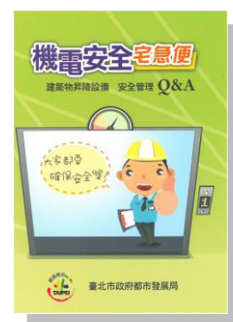
建築物昇降設備安 全管理 Q&A