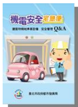
建築物機械停車設 備安全管理 Q&A